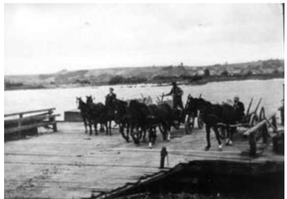
Wie in Güstebiese und Zollbrücke verkehrte auch bei Altrüdnitz eine Fähre, die vor allem für die Bauern, deren Flächen jenseits der Oder lagen, existenziell war. Zur Fähre gehörte ein Fährkrug - der "Spitz". Jener an den Altrüdniter Loosen wurde in den achtziger Jahren abgerissen, wogegen das Haus des alten Zollbrücker Fährkrugs noch vorhanden ist. Heute lebt nur noch der Name fort: die Neubauernsiedlung, die im Bereich der drei alten Loosegehöfte zwischen Oder und Neurüdnitz entstanden ist, trägt heute den Namen "Spitz".