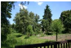
Im Sommer ist der Graben bei einem sehr niedrigen Wasserstand zugewachsen und voller Entengrütze. Erst nach der Krautung wird er richtig zu sehen sein.

Die Anlage von Schachtgräben war bei der Besiedlung üblich und diente der Entwässerung der Hofstellen. Der Bodenaushub wurde etwas entfernt vom Graben zu beiden Seiten aufgehäuft, so dass die Häuser etwas erhöht errichtet werden konnten. In Neulewin nahm man den natürlichen Wasserlauf des Lewingrabens auf, daher der geschlängelte Verlauf. Die Flächen zwischen Graben und Häusern befanden sich bis 1858 in königlichem Besitz, danach konnte die Gemeinde sie erwerben und an die Anlieger verpachten. Schon ab 1830 hatte die Nutzung als Gemüse- und Obstgärten begonnen. 1901 gründete sich der Verschönerungsverein, der in den Folgejahren unter anderem mit verschiedenen Wettbewerben für die Verbesserung des Dorfbildes sorgte. In dieser Zeit wurden die alten, teilweise zerbrochenen Kopfweiden entfernt und Birken nachgepflanzt, die jetzt an einigen Stellen des Dorfbanners prägend sind. Perle des Oderbruchs – so wird Neulewin vor dem 2. Weltkrieg häufig genannt. Anwohner berichten davon, dass es bis in die 1970er Jahre noch möglich und üblich war, auf Schlittschuhen entlang des Lewingrabens, der in den Stadtgraben mündete, bis zur Volzine zu fahren.