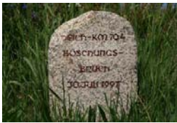
Gedenkstein an den Böschungsbruch vom Juli 1997 – die Bewohner des Bruchs nannten den glücklichen Ausgang das „Wunder von Hohenwutzen“.

Wer am Krummen Ort steht, kann leicht erkennen, woher der Flussabschnitt seinen sonderbaren Namen hat: Der Oderkanal macht hier eine scharfe Krümmung. Sie war nötig, um den weit ins Bruch hinein ragenden Neuenhagener Sporn an seiner niedrigsten Stelle durchschneiden und mit möglichst geringem Aufwand wieder das natürliche Bett der Oder erreichen zu können. Diese Stelle des Deiches ist bei hohem Wasserstand besonders gefährdet, weil das Wasser hier fast im rechten Winkel auf den Deich trifft und Erosionsschäden am Bauwerk verursachen können. Eisstauungen im Winter verstärken diesen Effekt noch. Der Parallelgraben wurde dicht am Deichfuß entlang gezogen, um das Drängewasser aufzunehmen. Für das mit vielen Gräben durchzogene Hinterland kommt nur die Nutzung als feuchtes Grünland infrage.