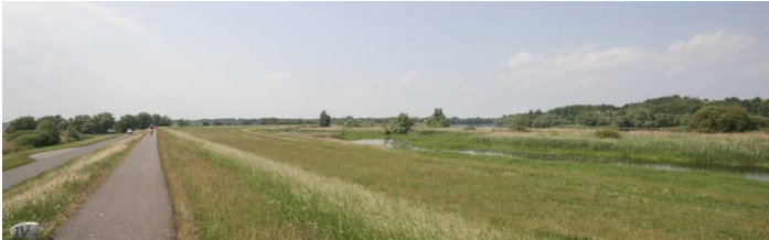
Der Krumme Ort bei Hohenwutzen. Der „Neue Oder-Canal“ hat hier aus dem Neuenhagener Sporn eine Insel gemacht.

Als am 30. Juli 1997 die Böschung des Deichs bei Hohenwutzen abrutschte, hielten viele Menschen den Atem an. Alle Mühen schienen umsonst gewesen zu sein, es konnte nur noch Minuten dauern, bis das Wasser die letzten Erdmassen beiseite drücken und das gesamte Oderbruch überfluten würde. Aber es kam anders. Der Deichfuß konnte stabilisiert werden - bis heute staunen selbst jene, die damals verzweifelt Sandsäcke in die nasse Wunde legten, wie die Böschung schließlich halten konnte. Am Deichkilometer 70,4 erinnert ein Stein an diese Stunden. Ein Rastplatz am Fuße des Deiches ist mit einem weiteren Gedenkstein versehen, der das ganze Hochwasserereignis und seinen glücklichen Ausgang vor Augen führen soll.